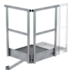
Abb. Bestell-Nr. 60942 (an zusätzl. Erweiterungspodest)