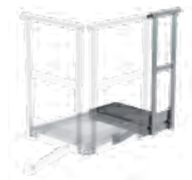
Abb. Bestell-Nr. 60941 (an bestehendem Grundpodest)